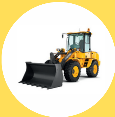
R482 CAT C1