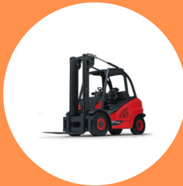
R489 CAT 3

CHARIOTS ÉLÉVATEURS FRONTAUX EN PORTE-À- FAUX (CAPACITÉ <6 TONNES)