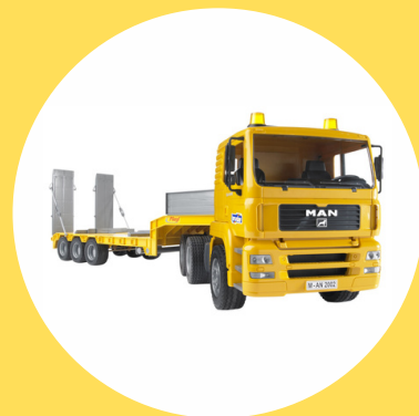
R486 CAT G