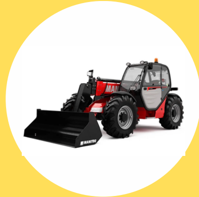
R482 CAT F

PELLES HYDRAULIQUES, À CHENILLES OU SUR PNEUMATIQUES, DE MASSE ≤ 6 TONNES