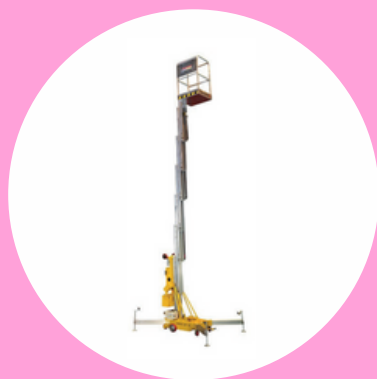
R486 CAT A TYPE 1 PLATEFORME ÉLÉVATRICE CISEAU MOBILE