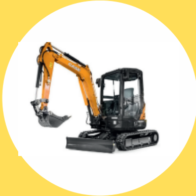
R482 CAT A

PELLES HYDRAULIQUES, À CHENILLES OU SUR PNEUMATIQUES, DE MASSE ≤ 6 TONNES