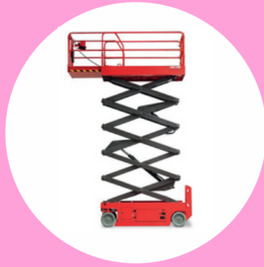
R486 CAT A TYPE 3 PLATEFORME ÉLÉVATRICE CISEAU AVEC STABILISATION