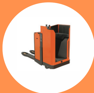
R489 CAT 1A