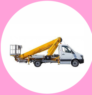
R486 CAT B TYPE 1 PLATEFORME ÉLÉVATRICE MULTIDIRECTIONNELLE AVEC STABILISATION