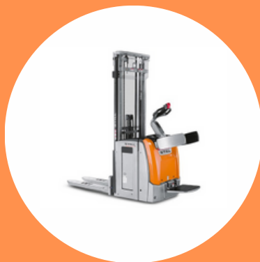
R489 CAT 1B