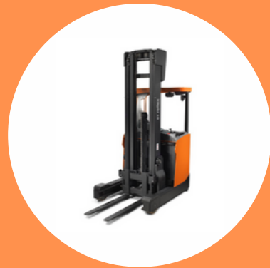
R489 CAT 5

CHARIOTS ÉLÉVATEURS FRONTAUX EN PORTE-À- FAUX (CAPACITÉ <6 TONNES)