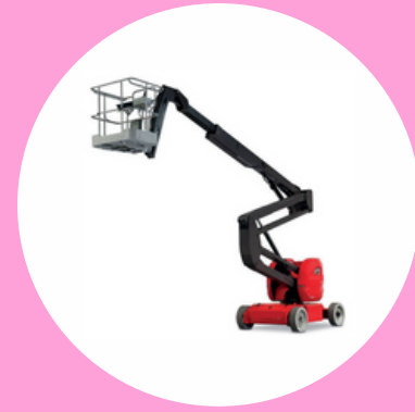
R486 CAT B TYPE 3 PLATEFORME ÉLÉVATRICE MULTIDIRECTIONNELLE MOBILE